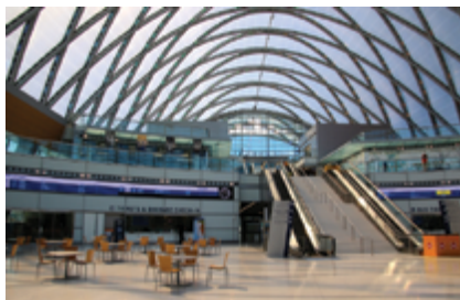
图 5. ARTIC 在铺设地板之前先安装了辐射冷却系统(上); ARTIC 内部地面的最终外观(下)。

和水温, 然后运行仿真计算。”团队人员利用仿真 App 直观地将结果展现给滑雪场的工作人员。仿真 App 在这项工作的完成过程中发挥了重要作用。