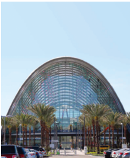
图 4. 阿纳海姆地区交通联运中心 (ARTIC)。

有助于减少必要的制冷能耗。研究人员利用仿真来确认地板的低温状态能持续多长时间, 以及这种策略是否可行。