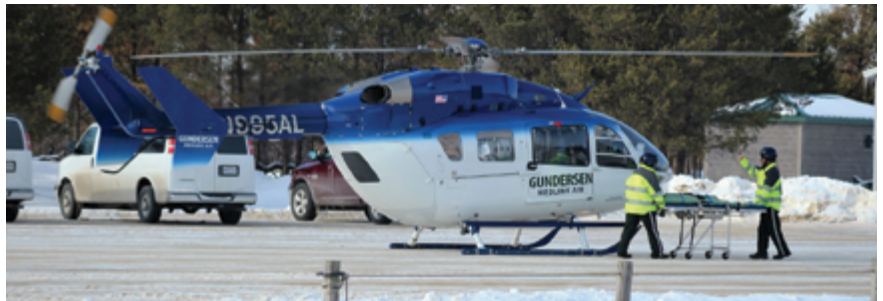
图 1. 装有 Viega 公司融雪系统的停机坪上的紧急救援直升机机库。

Viega 公司是一家设计和制造辐射采暖系统的公司, 擅长帮助客户解决那些需要特殊温度控制的情况。