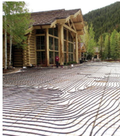
图 6. 爱达荷州太阳谷滑雪场铺设的管道。

借助 Viega 公司的设计和安装, 太阳谷滑雪场获益匪浅。滑雪场内的所有道路和高人流量区域都安装了融雪系统(图 6)。铲除这些区域的雪有时并不可行, 因此需要另一种除雪方法。融雪系统可以最大限度地减少清理、降低维护, 并且由于融雪过程不需要加入盐或化学品, 因此有助于保